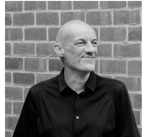
TEAM VLAAMS BOUWMEESTER