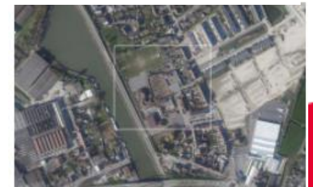
004103 Zwevegem Kappaertsite