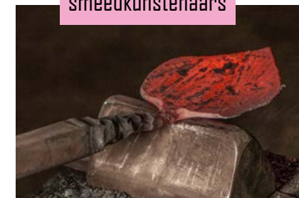
En heel wat smeedkunstenaars